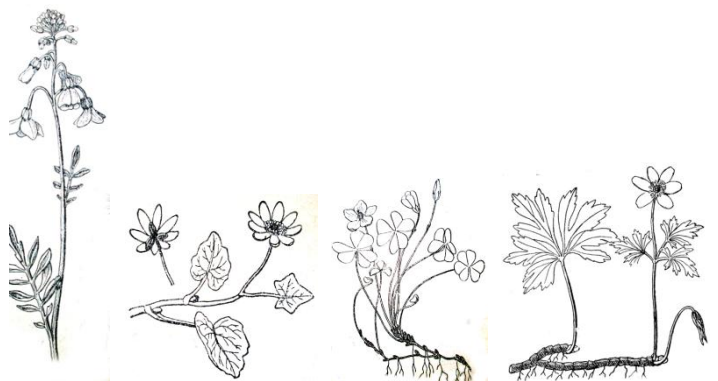
Pinksterbloem Speenkruid Witte Klaverzuring Bosanemooon

....April. En wat bloeit er? Een paar verdwaalde Pinksterbloemen, Speenkruid, Goudveil, Bosanemonen en Klaverzuring. Maar nog geen Krent.