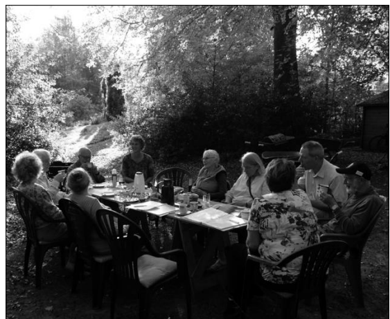
Werken en uitrusten