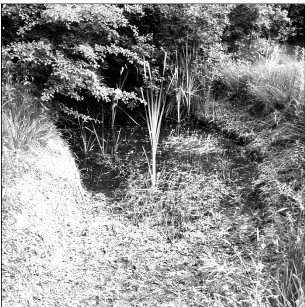
De drooggevallen leemkuil