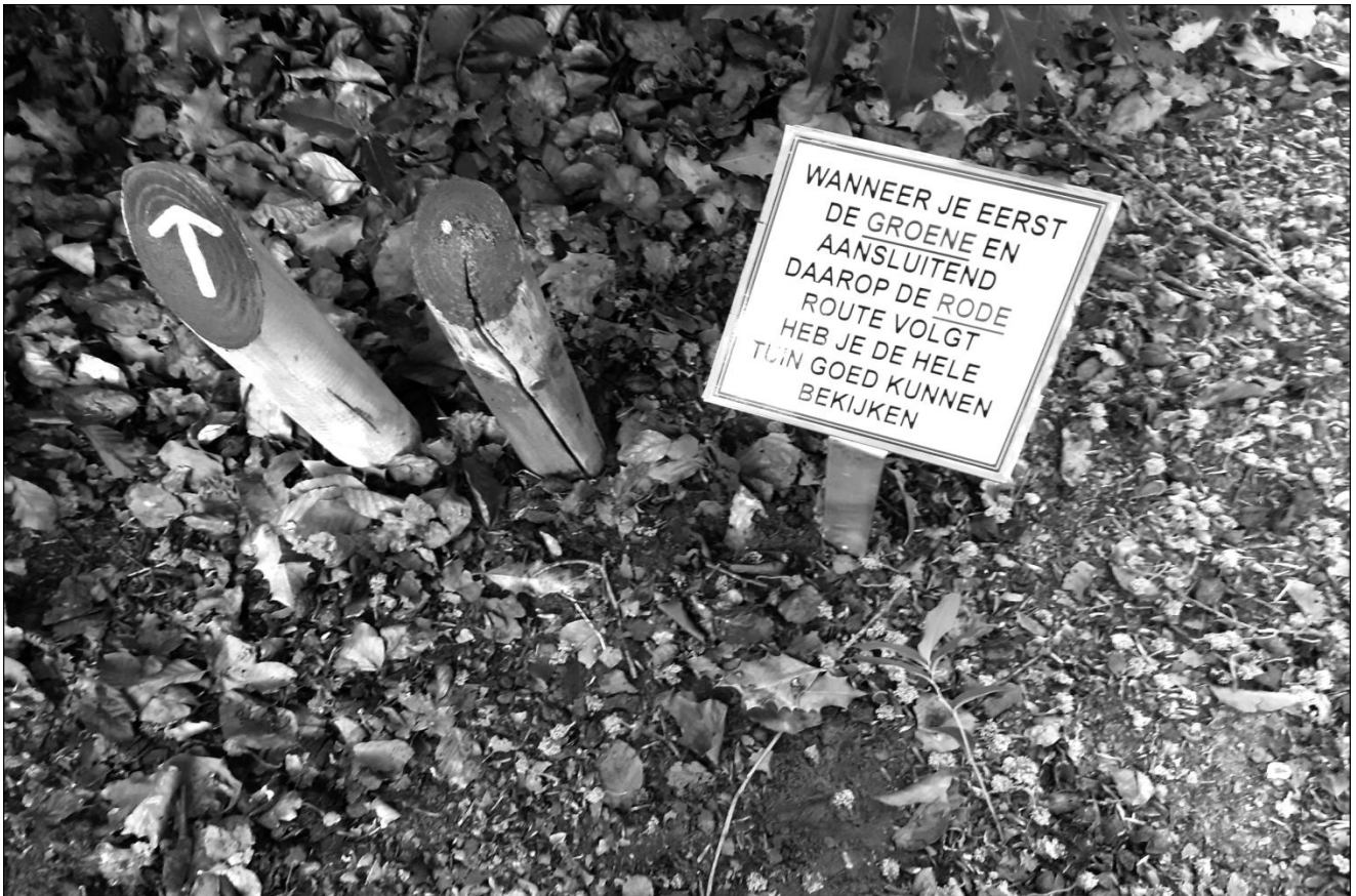
Routeaanduiding in de heemtuin bij het begin van de wandeling