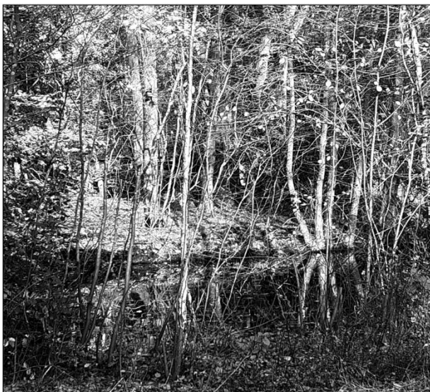
Zicht op de kleine vijver