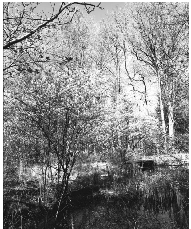
De tuin is de moeite waard

Het is fijn dat de groepsleden, ondanks de beperkingen en het wegvallen van veel gezamenlijke werkdagen, betrokken enthousiast zijn gebleven. We hopen van harte dat we in het nieuwe jaar weer als groep op onze mooie heemtuin kunnen werken en genieten. En we nodigen u uit om te tuin te komen bezoeken, het is de moeite waard!