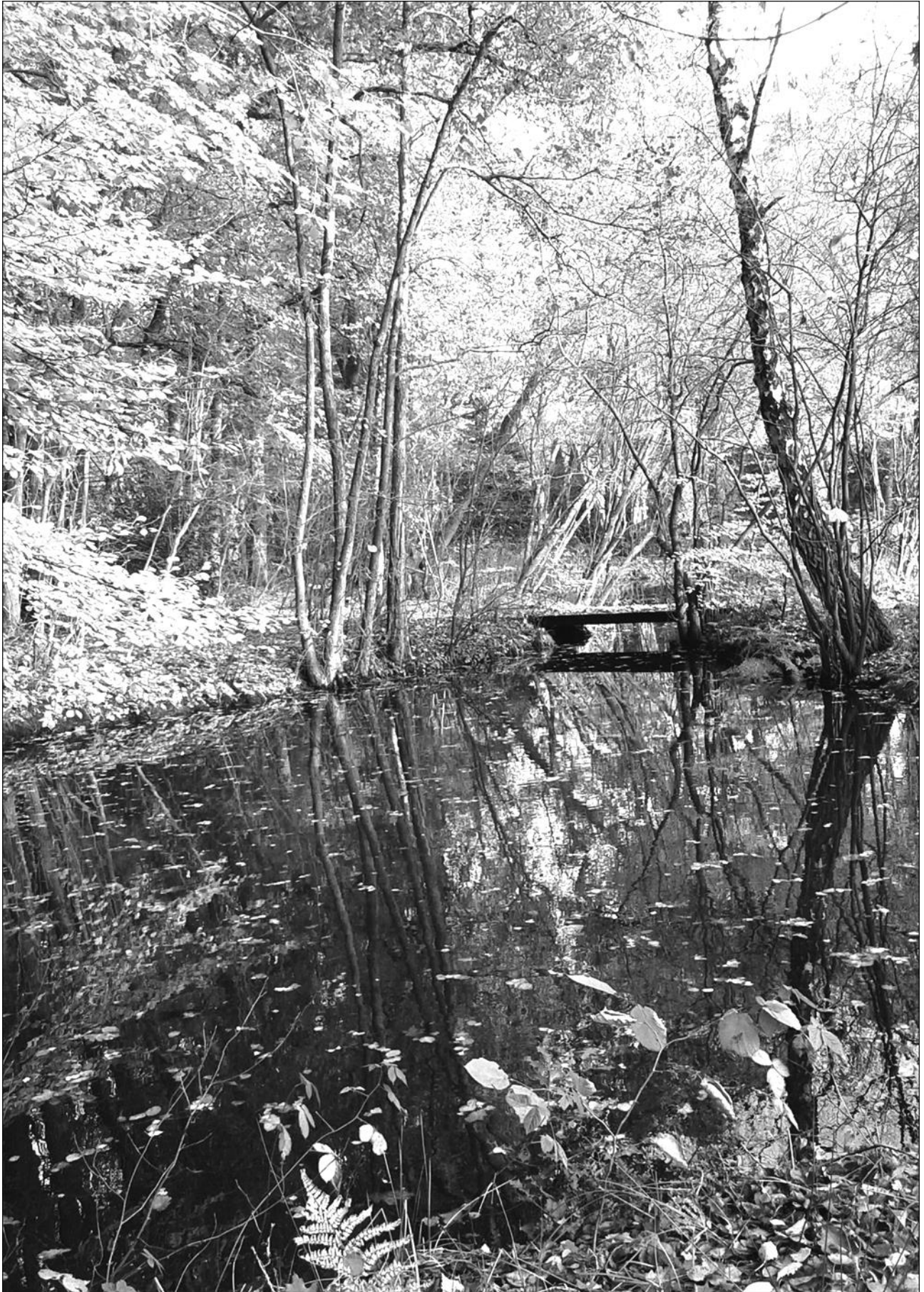
Hoe mooi is de Heimanshof!