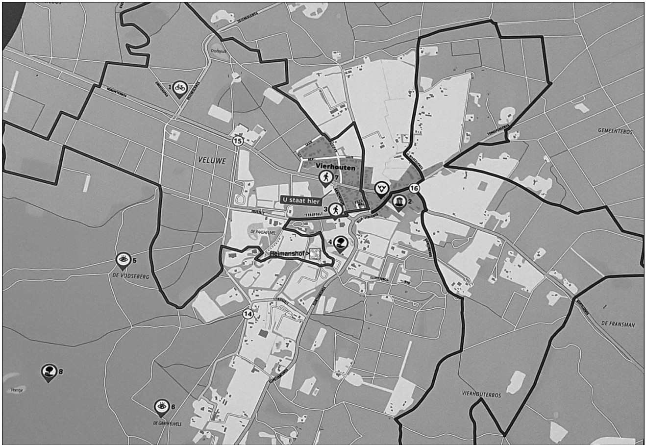
Plattegrond Vierhouten met aanduiding Heimanshof en andere attracties