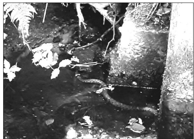
Ringslang achter de stuw

In de kolk achter het stuwte hebben we vandaag een ringslang gezien met een lengte van wel 70 cm. (mogelijk langer). Deze op de foto gezet. Toen de slang ontdekte dat wij er waren, verdween hij in de modder.