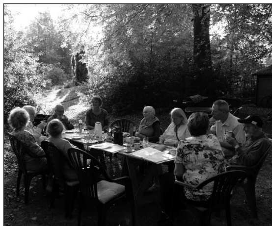
Werken en uitrusten