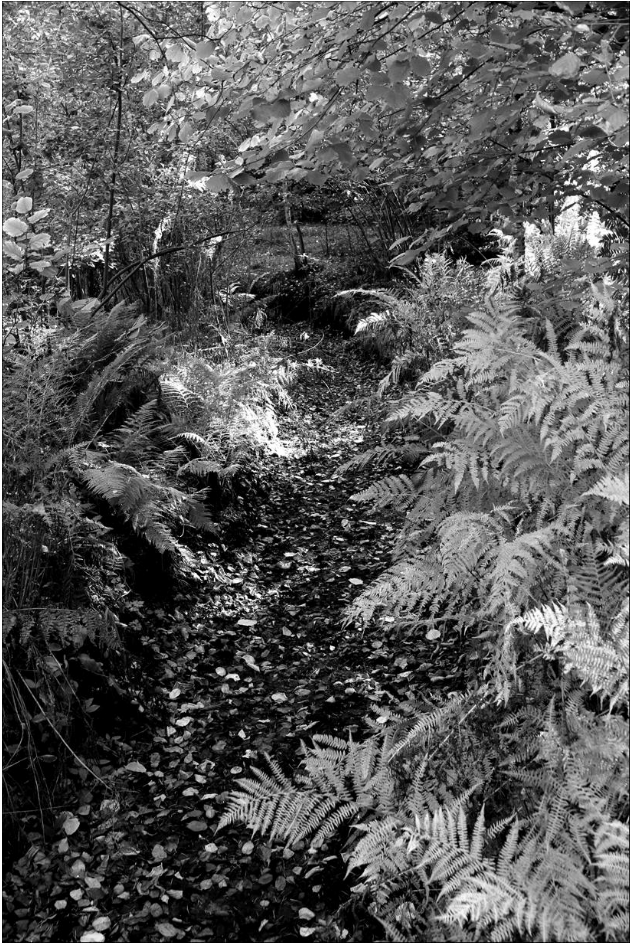
De droge beek